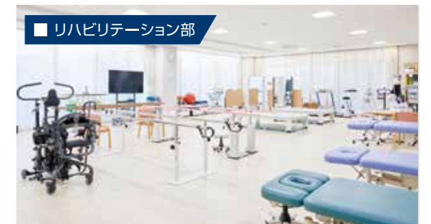
リハビリテーション部は、理学療法(PT)、作業療法(OT)、言語聴覚療法(ST)で構成され、患者様の状態に合わせて様々な心身機能の回復に向けたリハビリテーションを提供しています。