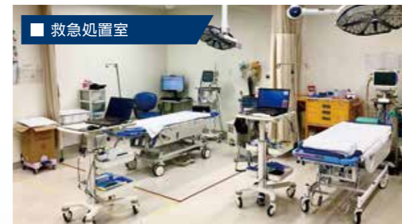
救急車の受け入れから、注射や点滴処置を受ける患者様のケアを行っています。多職種とチームワークをとりながら、迅速な診察、検査に繋げるように対応しています。