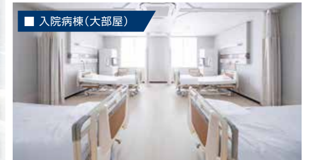
一般病棟は基本的には4人1部屋となっております。入院される患者様が快適に過ごせるよう努めてまいりますのでご相談等ございましたら、職員にお申し付けください。(個室部屋のご希望は別途費用有)