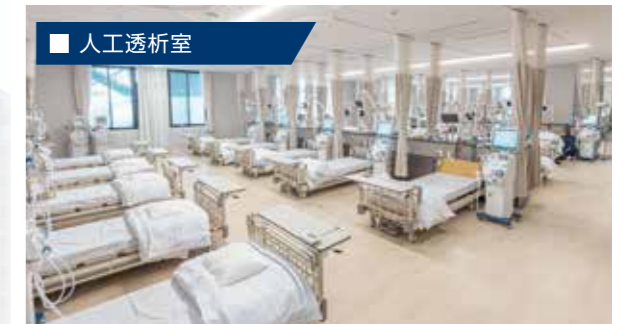
腎不全患者様の様々な症状や合併症に対する診療に力を注ぎ、血液透析を行っています。また血液透析をはじめ、様々な血液浄化療法に取り組み患者様の状態に合った治療を実施しています。