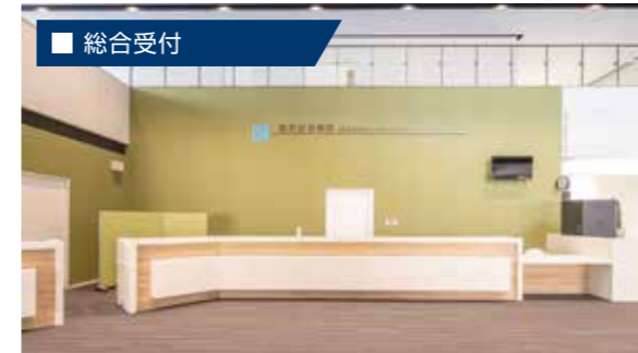
来院された皆様を初めにご案内いたします。ご質問、お困りごとがございましたら、お声がけください。

HCU(16床)／一般病棟(141床)／地域包括ケア病棟(54床)／回復期リハビリテーション病棟(54床)／医療療養型病棟(216床) 病床数 481床