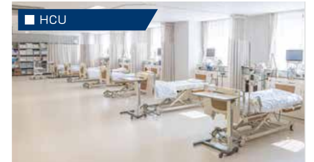
HCUは「High Care Unit」の頭文字をとったものであり、日本語では「高度治療室」や「準集中治療管理室」と訳され、ICUと一般病棟の中間に位置するとされています。